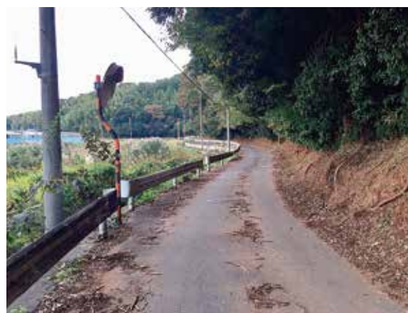
東光院平山お願い薬師前の平山町50号線