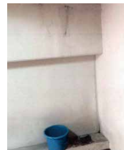
市内A中学校の雨漏り