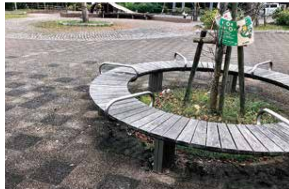
誉田駅北口駅前広場公園のたばこポイ捨ての状況

市は「鎌取駅には巡視員による指導を継続していく。駅周辺や公園・通学路等へ路面標示や看板等の掲示を行い、路上喫煙やポイ捨ての防止に取り組む」と答えました。また禁煙支援の取り組みとして禁煙治療費助成制度を創設することを提案すると、市は「治療費助成制度の創設についても検討する」と答えました。